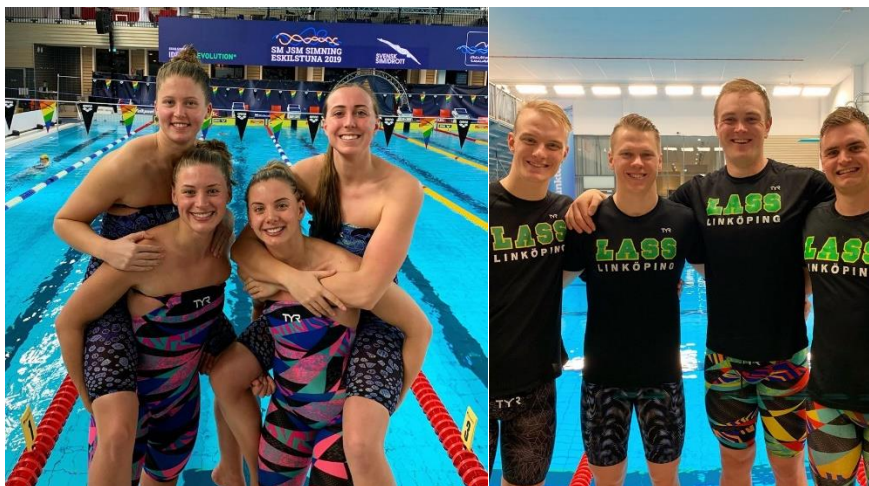
4x100 fr damlaget och 4x100 medley herrlaget SM/JSM 2019 25m

För den som vill utveckla sig i de olika simsätten och dessutom tävla erbjuder LASS stora möjligheter. Utvecklingen sker stegvis och är anpassad efter bl.a. ålder, träningsvana, mognad och ambition. LASS har för närvarande nio olika nivåer av tävlingsgrupper där våra yngsta simmare tränar någon eller några gånger i veckan och våra elitsimmare, som tävlar både på nationell och internationell nivå, tränar upp till 10-12 gånger per vecka. LASS simtränare är utbildade via Svensk Simidrott, många har kompletterat med olika typer av vidareutbildning.