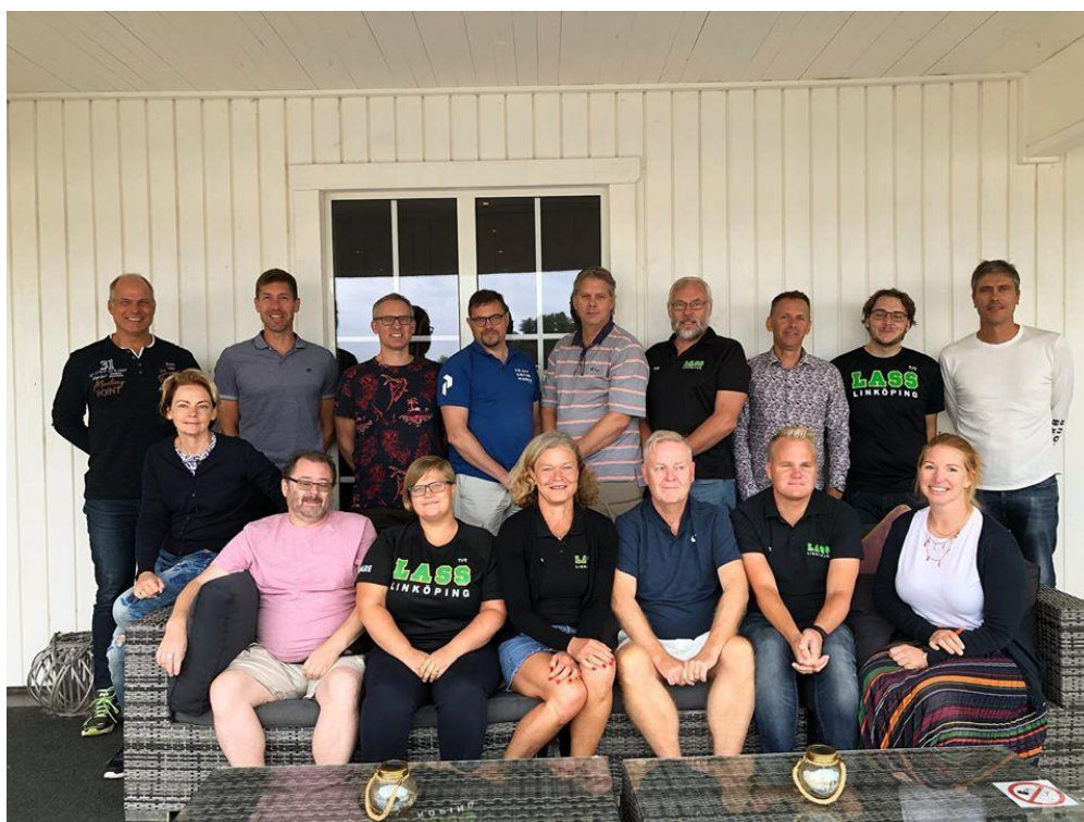
Styrelse, kommittéer och personal på 2019 års Kick-off