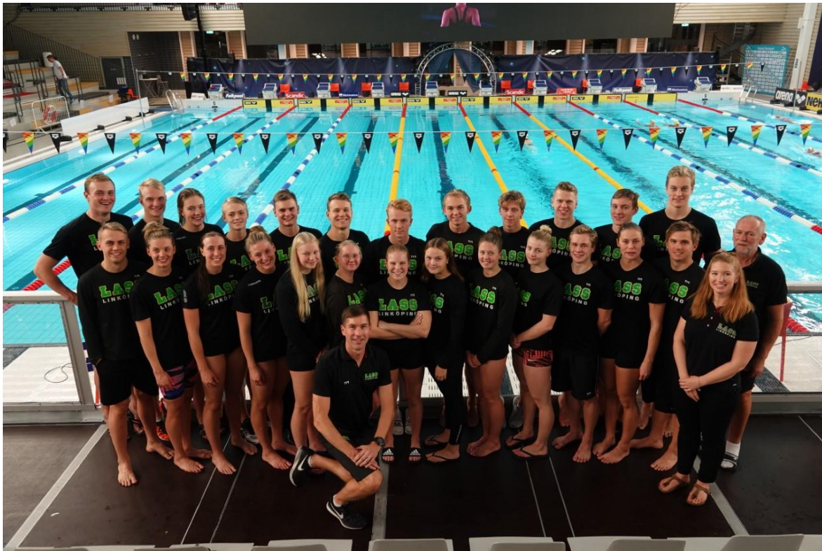
SM/JSM-truppen 2019 25m